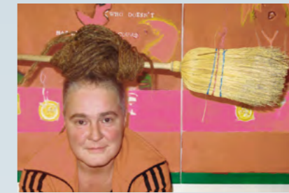
Die internationale Künstlerin Julia Starsky wird am 28. März um 19 Uhr am Hauptplatz ihre provokante Licht- und Musikshow „Ode an die Selbstbestimmung“ zeigen.