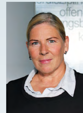
Die ehemalige Gesundheitsministerin Andrea Kdolsky beschäftigt sich am 17. März ab 18.30 Uhr im Foyer des Krankenhauses mit Fragen wie „Ist Gesundheit weiblich?“.