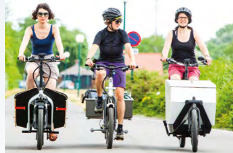
Am 2. April können von 16 bis 18 Uhr verschiedene E-Transportfahrräder am Hauptplatz getestet werden.

Wer die Vorteile von Transportfahrrädern kennenlernen will, hat am 2. April die ideale Möglichkeit dazu: Im Rahmen der Smart Cities Initiative des Klima- und Energiefonds Österreich gibt es im Rathaus (3. Stock/Trauerungssaal) ab 18 Uhr einen Infoabend für interessierte Bürgerinnen und Bürger. Vorab können zwischen 16 und 18 Uhr verschiedene E-Transporträder vor dem Rathaus getestet werden. Bei diesem ersten Treffen wird das Interesse an einem Transportrad-Sharing-System in Freistadt erhoben und es werden folgende Fragen diskutiert: